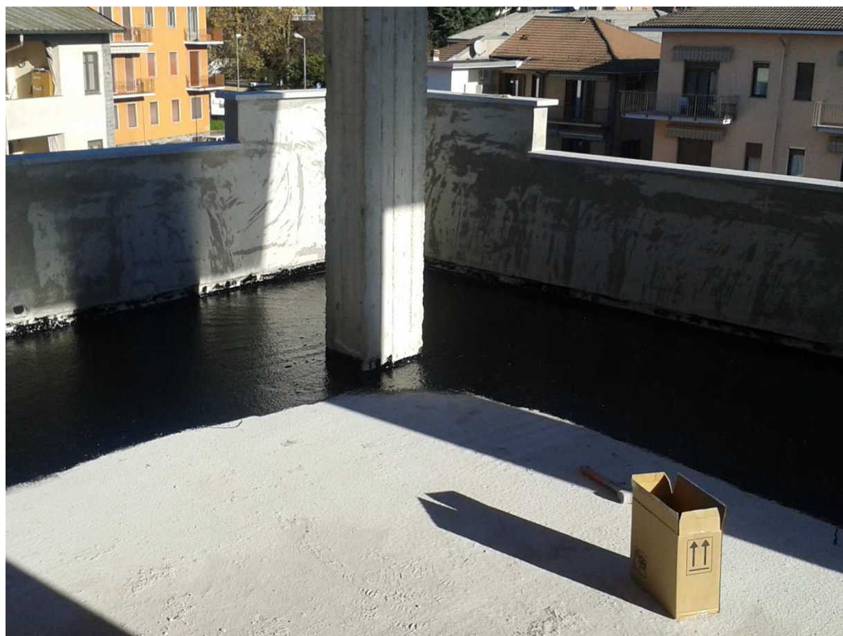
Particolare a lavoro concluso