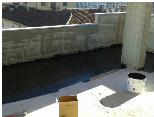
Stesura a rullo della membrana liquida black-o-flex